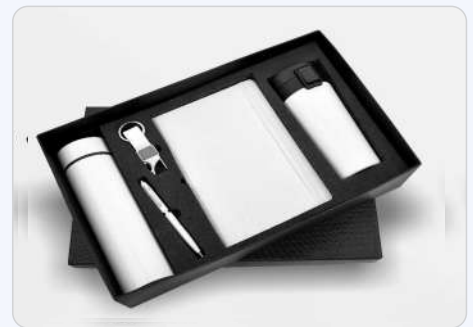
5 in 1 Black Temperature Bottle, Diary, Pen, Keychain & Vacuum Mug