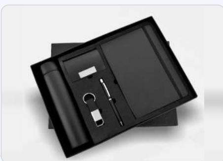
5 in 1 Black Temperature Bottle, Diary, Pen, Keychain & Cardholder