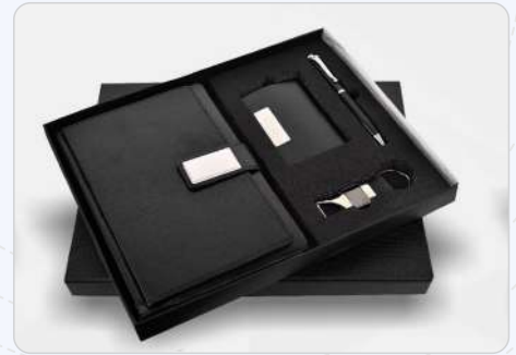
4 In 1 Set Black Diary, Pen, Keychain & Cardholder