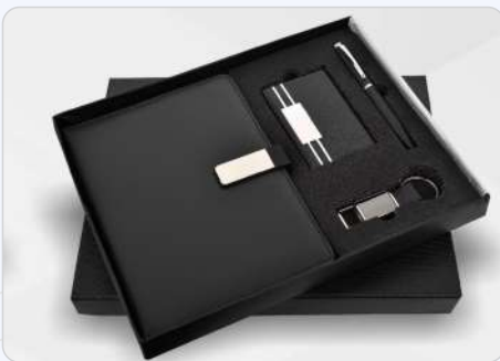
Blackwood Bottle, Diary, Keychain, Mug, Pen & Mobile Stand