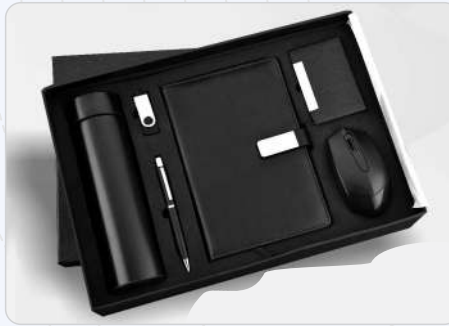
6 In 1 Wireless Mouse, Cardholder, Diary, Pen, 16 Gb Pen Drive