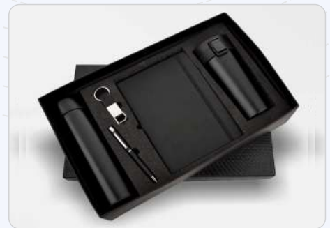
5 in 1 Black Temperature Bottle, Diary, Pen, Keychain & Vacuum Mug