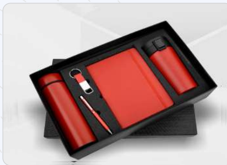
5 in 1 Red Temperature Bottle, Diary, Pen, Keychain & Vacuum Mug