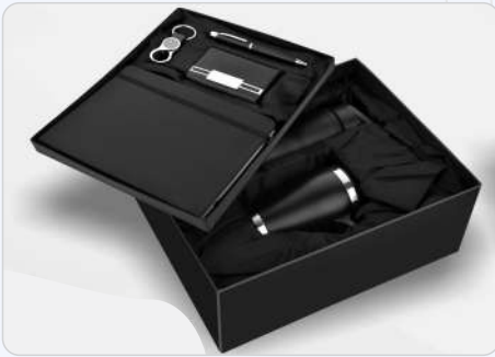
6 In 1 Employee Kit Diary, Pen, Keychain, Cardholder, Mug & Bottle