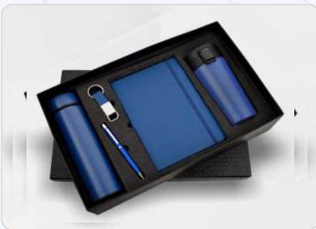
5 in 1 Blue Temperature Bottle, Diary, Pen, Keychain & Vacuum Mug