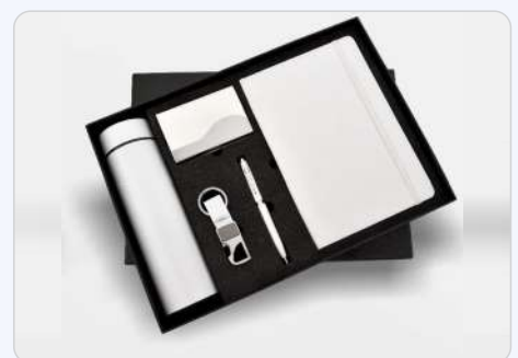
5 in 1 White Temperature Bottle, Diary, Pen, Keychain & Cardholder