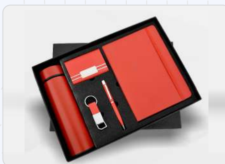
5 in 1 Red Temperature Bottle, Diary, Pen, Keychain & Cardholder