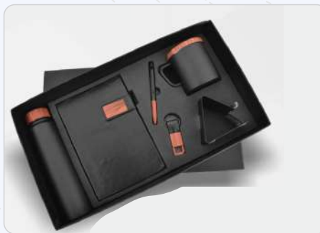
4 In 1 Set Black Diary, Pen, Keychain & Cardholder